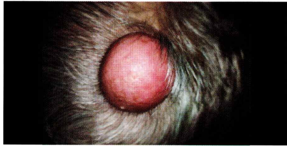
Figura 1: Tumor triquilemal proliferante en región occipital de cuero cabelludo

Se realizó radiografía y tomografía computarizada para detectar metástasis con resultados dentro de los parámetros normales. Se realiza una resección local amplia con márgenes 1 cm y en profundidad hasta el plano muscular. (Figura 3) No se administró tratamiento adyuvante porque los márgenes quirúrgicos fueron negativos. El paciente no presentó complicaciones durante y después de la operación. Se recomienda seguimiento cada 6 meses.