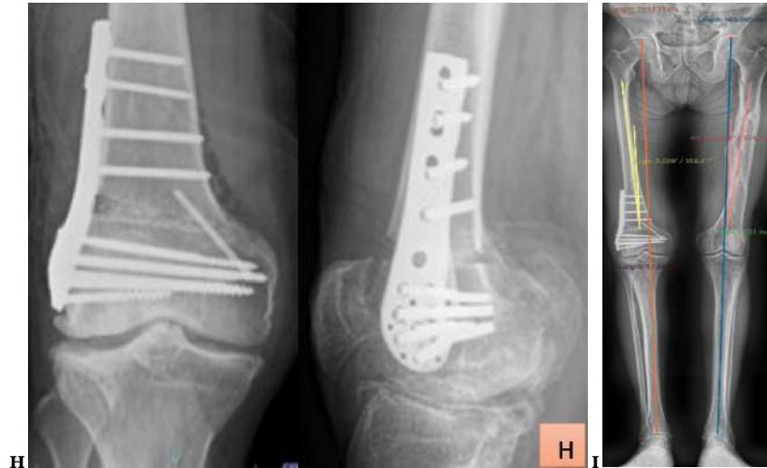
Fig. A: Gonartrosis grado III (Kelgren y Lawrence) rodilla derecha, más afectado el compartimento externo. Fig. B: En la telemetría se observa genu valgum derecho de 15 grados, el eje de carga desviado 3,31 cm hacia afuera del centro de la rodilla. Fig. C: Planificación prequirúrgica del corte, se inicia 1,5 cm por encima del cóndilo externo y se dirige oblicuamente en un ángulo de 15 a 20 grados hacia el tubérculo de los aductores. Fig. D: Fijación de cortical interna con clavo Steinmann de 2.5 mm en el sitio que corresponde a la bisagra interna, luego se pasa clavo de Steinmann de 3,5 mm conforme lo planificado, este clavo nos servirá de guía para el corte con sierra oscilante y escoplo, aquí el clavo del lado interno nos protege y evita que el corte avance más allá de la bisagra, el cirujano puede sentir cuando choca con el clavo interno, protegiendo la zona y evitando su fractura. Fig. E: Apertura de osteotomía de 10 mm con pinza Spreader, se adosa la placa LISS moldeada Fig. F: Se colocan todos los tornillos de la placa para estabilizar y mantener la apertura. Fig. G: Se rellena la apertura con 30 gramos de injerto óseo de banco. Fig. H: Control radiológico transquirúrgico, se retiró de clavo Steinmann del lado interno y fijación definitiva de cortical interna con tornillo de compresión sin cabeza de Acutrak de 4 mm x 50 de mm de largo. Fig. I: Telemetría postquirúrgica, el eje de la extremidad derecha esta 3.02 grados en valgo. Documento grafico del Hospital Alcívar.