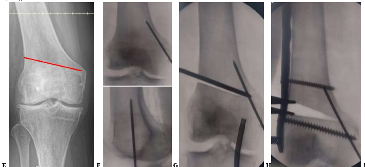
Figura 1. Registro gráfico del caso clínico.