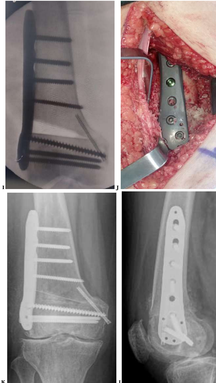
Fig. D: Planificación prequirúrgica del corte, se inicia 1,5 cm por encima del cóndilo externo y se dirige oblicuamente en un ángulo de 15 a 20 grados hacia el tubérculo de los aductores. Fig. E: Fijación de cortical interna con clavo Steinmann de 2,5 mm en el sitio que corresponde a la bisagra interna. Fig. F: Colocación de clavo de Steinmann de 3,5 mm conforme lo planificado, este clavo nos servirá de guía para el corte con sierra oscilante y escoplo, aquí el clavo del lado interno nos protege y evita que el corte avance más allá de la bisagra, el cirujano puede sentir cuando choca con el clavo interno, protegiendo la zona. Fig. G: Se realiza apertura de 1,5 cm con una pinza Spreader, se adosa la placa LISS previamente moldeada y se la fija con los tornillos más proximales a la osteotomía. Fig. H: Se completa la fijación de la placa con los demás tornillos, se cambia el clavo de Steinmann del lado interno por un tornillo de compresión sin cabeza Acutrak de 4 mm. Fig. I: Se rellena la apertura con 30 gramos de injerto óseo de banco. Fig. J: Control radiológico transquirúrgico. Documento gráfico del Hospital Alcívar.