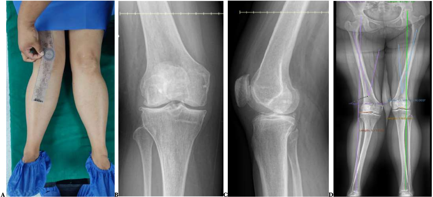
Fig. A : Paciente de 46 años con Genu valgum de rodilla derecha. Fig. B: Artrosis Grado II del compartimento externo rodilla derecha Fig. C: En la telemetría hay genu valgum de 21 grados con una desviación del eje mecánico de 5,7 cm hacia afuera del centro de la rodilla derecha.