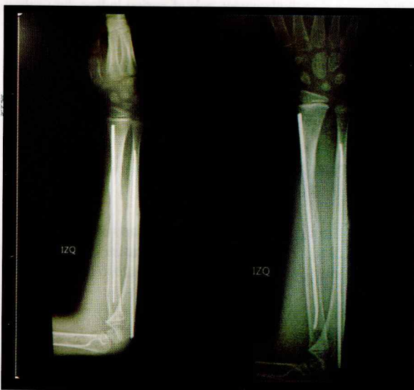
Figura 4: radiografía a las 24 semanas, se aprecia fractura totalmente consolidada, sin signos de pseudoartrosis.