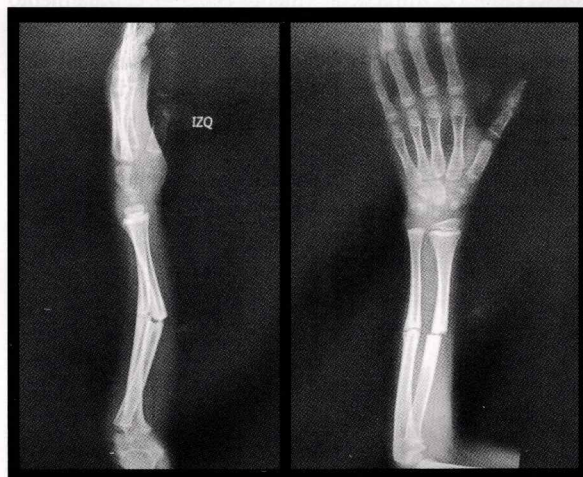
Figura 1: Radiografía preoperatoria observándose persistencia de brecha fracturaria con bordes escleróticos (Seudoartrosis)

Se planificó reducción abierta más fijación con clavos intramedulares flexibles, del mayor diámetro posible, con los cuales se consiguió reducción anatómica y fijación estable, los controles radiográficos mensuales mostraron consolidación radiológica de la pseudoartrosis (imagen 2, 3, 4) conjuntamente con la recuperación de rangos funcionales completos para la flexión, extensión, pronación y supinación; (imagen 5) además la fuerza muscular y a la aprehensión eran similares a la extremidad contralateral, con una puntuación en la escala de DASH del 98% con lo cual el paciente tuvo un reintegro total a sus actividades escolares y familiares.