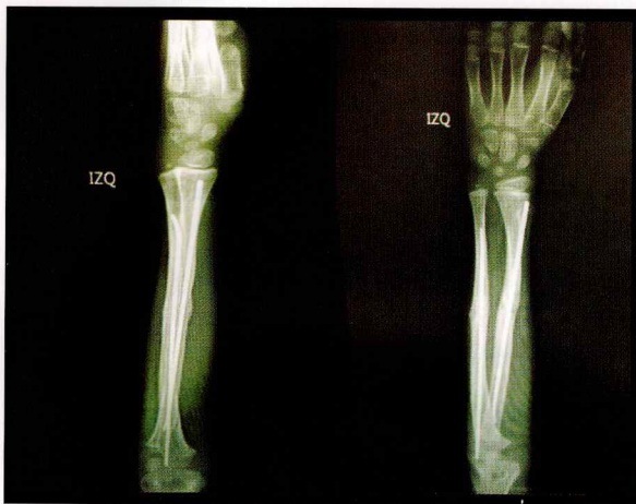
Figura 3: radiografía a las 14 semanas donde se observa suficiente callo como para determinar que la consolidación es evidente y que la pseudoartrosis está en franco proceso de resolución.