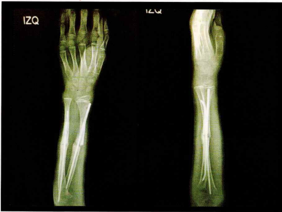
Figura 2: radiografía a las 6 semanas donde se observa callo óseo en formación y cómo este comienza a cubrir la pseudoartrosis.