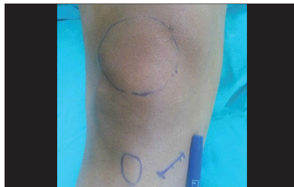
Fig 2 Incisión Oblicua