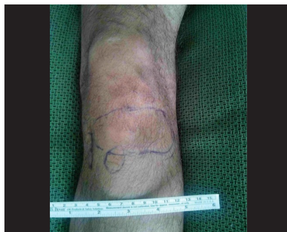
Fig 4 Area parestesia