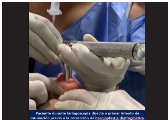
Figura 1: Intubación de paciente

Nacido por cesárea, producto único vivo, sexo femenino, APGAR 8-10, líquido amniótico claro, peso 3.600 g, talla 51 cm, con distrés respiratorio (Silverman 3/10) con tiraje intercostal y subcostal, taquipnea inicialmente manejado con oxihood sin mejoría y que posteriormente es intubado con secuencia rápida, tubo 3,5 y en nuestra unidad cambiado a tubo 4 por fuga evidente audible. (Figura 1).